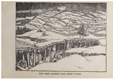
Ilustracja z książki Boje legionistów polskich. Bitwa pod Łowczówkiem, Piotrków 1916.

I wtedy okazuje się, że wcześniejszy rozkaz jest pomyłką sztabu Pattaya. Polacy wracają, ale ich okopy są już zajęte przez Rosjan. W twarz dostają karabinowe salwy. A więc bagnety na broń i szturm. Nieprzyjaciel wyparty. Znowu zajmują umocnienia na wzgórzu 360, pozycje które dają strategiczną przewagę. Rosjanie usuwają się gdzieś w pobliże. Zapada ciemność. Walka dogasa. Następuje jakieś nieformalne zawieszenie broni. Wtedy właśnie dochodzi do sytuacji niezwyklej.