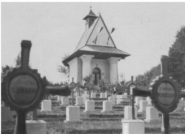
Cmentarz legionistów w Łowczówku na zdjęciu z okresu międzywojennego

Walka Polaków zdobyła uznanie wśród dowódców po obu stronach frontu. Jak podsumowuje Przemysław Waingertner, legioniści przeprowadzili pięć ataków, odparli 16 rosyjskich natarć, utrzymując linię frontu. Wzięli do niewoli 600 carskich żołnierzy. Rosjanie stracili około cztery tysiące zabitych, a niektóre ich oddziały zostały zdziesiątkowane.