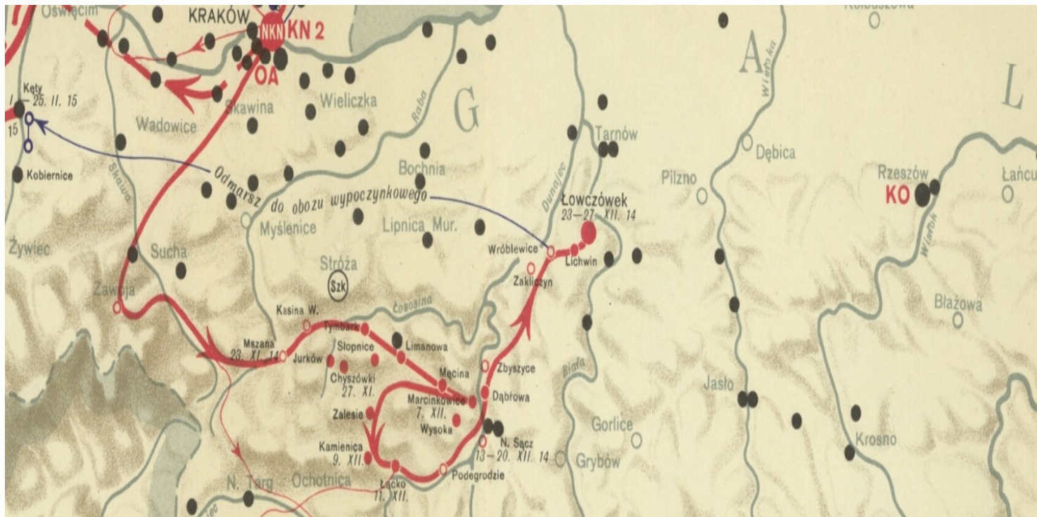
Mapa Szlakiem Legionów w opracowaniu Teofila Szumańskiego, Lwów 1934 r.

https://przystanekhistoria.pl/pa2/tematy/polskie-wojsko/61008,Lowczówek-krwawa-Wigilia-Pierwszej-Brygady.html