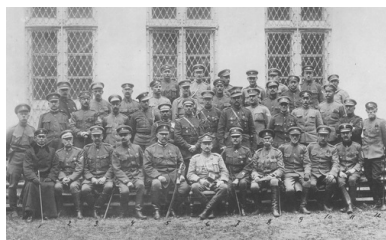
Dowódcy oddziałów I Korpusu Polskiego z generałem Józefem Dowborem-Muśnickim (siedzi 6. z lewej), Bobrujsk 1917 r.

A Maria Dąbrowska w swoich Dziennikach, choć nieco bardziej sceptyczna wobec informacji o sukcesach polskich wojsk na Wschodzie, również dawała upust swemu zachwytowi dla gen. Dowbora: „To, co robi Dowbór-Muśnicki, to jakby baśń historii”.