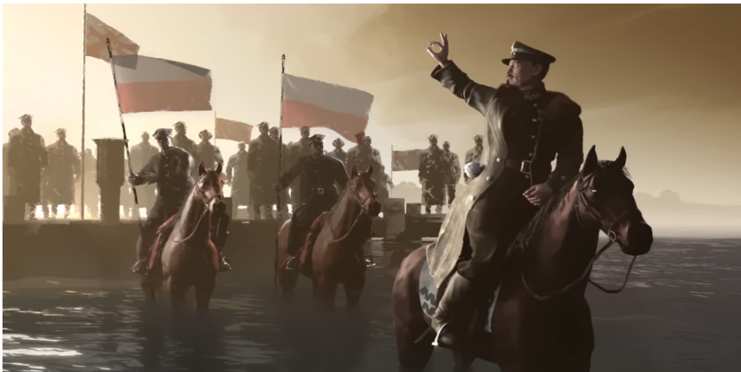
Kadr z filmu IPN „Niezwyciężeni. Czas próby”

https://przystanekhistoria.pl/pa2/tematy/polskie-wojsko/57858,Blekitny-General-w-wojnach-o-granice.html