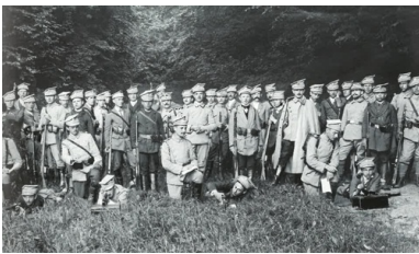
Żołnierze Legionu Wschodniego ćwiczą strzelanie z karabinów. Dublany k. Lwowa, lato 1914 r.