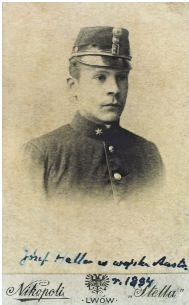
Józef Haller jako elew Wojskowej Akademii Technicznej w Wiedniu w 1894 r.