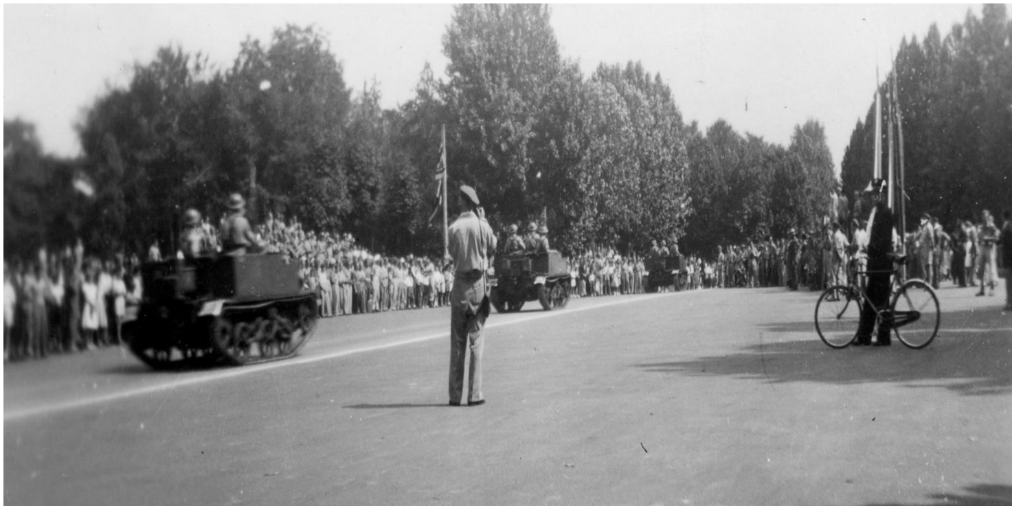
Lekkie transportery gąsienicowe Universal Carrier z żołnierzami 4. Wołyńskiej Brygady Piechoty, wchodzącej w skład 5. Kresowej Dywizji Piechoty, przejeżdża ulicą (Foro Buonaparte?) przed zamkiem Sforzów (wł. Castello Sforzesco) podczas defilady przed dowódcą 2. Korpusu Polskiego gen. dyw. Władysławem Andersem z okazji Święta Żołnierza. Mediolan, 15 VIII 1946 r.

https://przystanekhistoria.pl/pa2/tematy/polskie-wojsko/102757,Z-ziemi-wloskiej-Defilada-2-Korpusu-Polskiego-w-Mediolanie.html