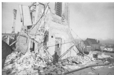
Na górnej kondygnacji zniszczonego budynku Komitetu Wojewódzkiego PZPR w Gdańsku. W tle kościół ojców oblatów pw. św. Józefa.

Kolęda była okazją do dyskusji na temat sytuacji politycznej, społecznej i ekonomicznej w kraju. Dzielono się plotkami i przypuszczeniami, księża zbierali informacje od wiernych i sami przekazywali swoją wiedzę. Rozmowy te z całą pewnością pomagały zweryfikować oficjalne przekazy. Niektóre wypowiedzi, dzięki pracy agentury, docierały do funkcjonariuszy Służby Bezpieczeństwa, dlatego w meldunkach skrupulatnie odnotowywano szczególnie te opinie, w których księża winą obarczali ustrój, rządzących i milicję. Z perspektywy władz postawa duchowieństwa w czasie kolędy zagrażała ich monopolowi na informację.