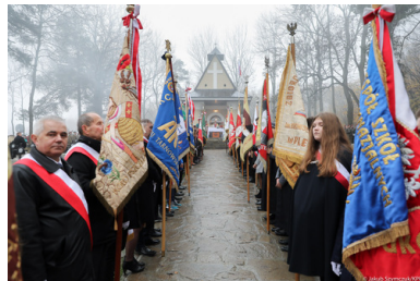
Cmentarz legionistów w Łowczówku na zdjęciu z okresu międzywojennego