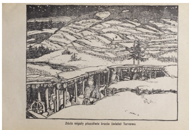
Ilustracja z książki Boje legionistów polskich. Bitwa pod Łowczówkiem, Piotrków 1916.

I wtedy okazuje się, że wcześniejszy rozkaz jest pomyłką sztabu Pattaya. Polacy wracają, ale ich okopy są już zajęte przez Rosjan. W twarz dostają karabinowe salwy. A więc bagnety na broń i szturm. Nieprzyjaciel wyparty. Znowu zajmują umocnienia na wzgórzu 360, pozycje które dają strategiczną przewagę. Rosjanie usuwają się gdzieś w pobliże. Zapada ciemność. Walka dogasa. Następuje jakieś nieformalne zawieszenie broni. Wtedy właśnie dochodzi do sytuacji niezwyklej.