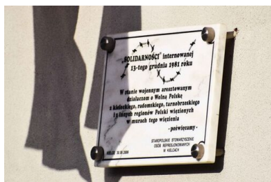
Tablica pamiątkowa na ścianie aresztu śledczego Kielce-Piaski, 2021 r.

368 internowanych, w tym 354 mężczyzn i 14 kobiet. W kolejnych tygodniach część osób zwalniano, kobiety przewożono do innych ośrodków, głównie w Gołdapi. Według przybliżonych danych, łączna liczba internowanych, którzy przez krótszy bądź dłuższy okres przebywali na „Piaskach”, to prawie 900 osób.