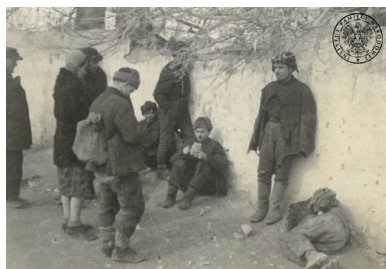
Polscy ochotnicy w drodze do punktów zbórnych armii Andersa

Na mocy układu nastąpiło m.in. wznowienie relacji dyplomatycznych między RP i ZSRS (zerwanych jednostronnie przez ZSRS 17 września 1939 r. wskutek wykonania zobowiązań paktu Ribbentrop-Mołotow), a strona sowiecka zezwoliła na utworzenie Armii Polskiej