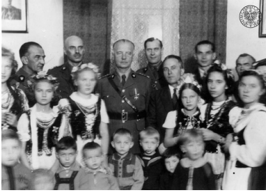
Władysław Sikorski i Władysław Anders z polskimi dziećmi