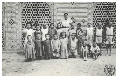
Polskie dzieci w Isfahanie

Powstanie Armii Polskiej w ZSRS było bezpośrednim wynikiem zawarcia układu Sikorski-Majski w dniu 30 lipca 1941 r., ten zaś z kolei był skutkiem napaści Niemiec na ZSRS, zmiany sojuszy i włączenia przez aliantów ZSRS do koalicji antyhitlerowskiej, dla której zagrożeniem były napięte relacje polsko-sowieckie.