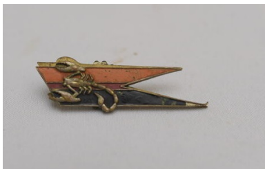
Przypinka z symbolem 4 Pułku Pancernego „Skorpion”.