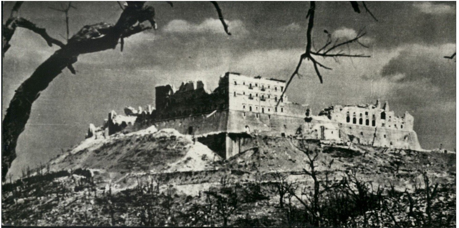
Ruiny klasztoru na Monte Cassino na fotografii ze zbioru przekazanego do Oddziałowego Archiwum IPN w Poznaniu

https://przystanekhistoria.pl/pa2/tematy/polskie-sily-zbrojne-po/125236,Andersowiec.html