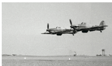
Samoloty Hawker Hurricane II w locie koszącym nad pustynią w okresie bazowania jednostki w Qassasin w marcu 1944 r.

Dywizjon składał się z 2 eskadr bojowych (z pilotami), które nominalnie liczyły po 6 samolotów, a także eskadry technicznej (z personelem naziemnym); 6 dodatkowych maszyn stanowiło rezerwę, toteż jednostka według etatu miała 18 samolotów. Cały personel latający dywizjonu stanowili oficerowie. Początkowo 318. Dywizjon w dokumentach określano mianem „Dywizjonu Współpracy”, ale wkrótce przeniesiono go organizacyjnie pod rozkazy Lotnictwa Myśliwskiego RAF i pod koniec czerwca 1943 r. nazwę zmieniono na „Dywizjon Myśliwsko-Rozpoznawczy”, która pozostała na stałe. W niektórych dokumentach z późniejszego okresu wojny 318. nazywano po prostu „Dywizjonem Rozpoznawczym”, co chyba najlepiej oddaje jego rzeczywisty charakter.