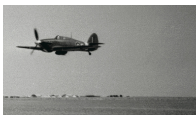
Samolot Hawker Hurricane II w locie koszącym nad pustynią w okresie bazowania jednostki w