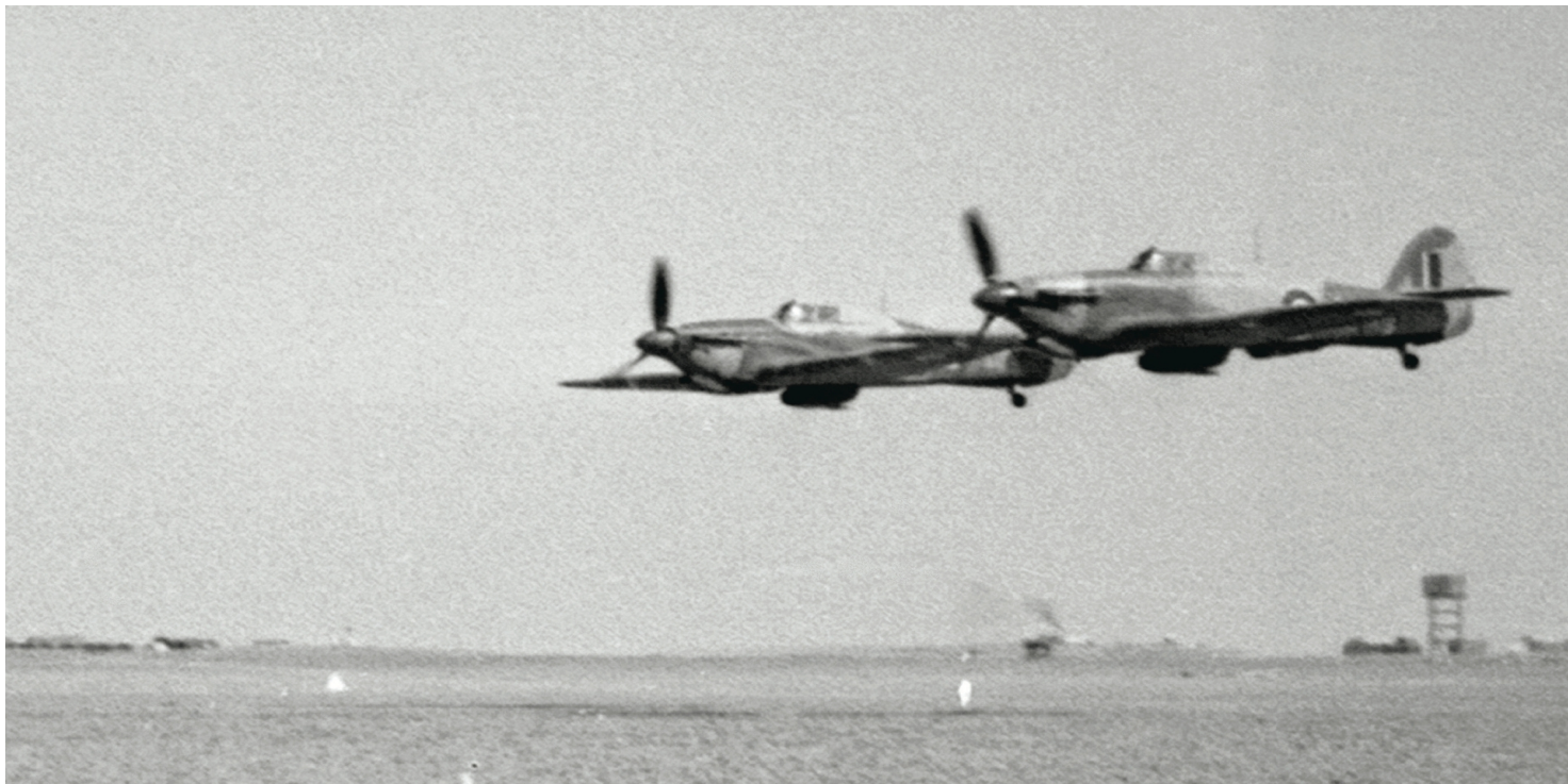
Samoloty Hawker Hurricane II w locie koszącym nad pustynią w okresie bazowania jednostki w Qassasin w marcu 1944 r.

https://przystanekhistoria.pl/pa2/tematy/polskie-sily-zbrojne-po/125146,Oczy-nad-frontem-wloskim-318-Dywizjon-Mysliwsko-Rozpoznawczy-Gdanski.html