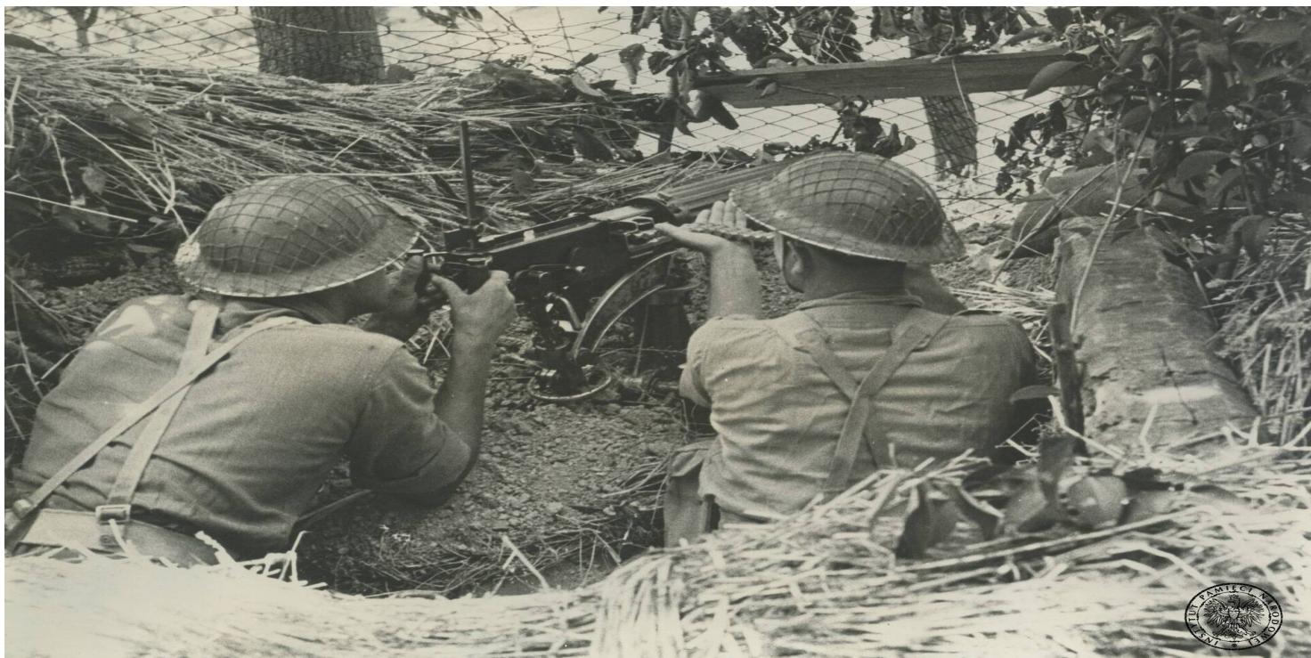
Obsługa ciężkiego karabinu maszynowego 7,69 mm Vickers Mk I na podstawie Mk IVB z jednego z oddziałów 2. Korpusu Polskiego na zamaskowanym stanowisku w Ankonie. Odbitka rozpowszechniana przez komórki propagandy rządu RP na uchodźstwie

https://przystanekhistoria.pl/pa2/tematy/polskie-sily-zbrojne-po/102090,Bitwa-o-Ankone.html