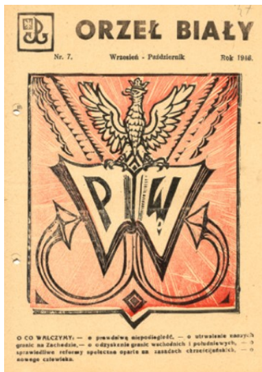
Winieta podziemnego miesięcznika „Orzeł Biały” wydawanego w Obszarze Południowym WiN.