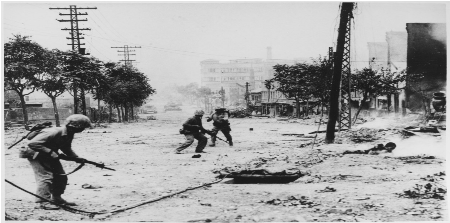
Amerykańscy marines w czasie walk miejskich w Seulu, 1950 r. (domena publiczna)

https://przystanekhistoria.pl/pa2/tematy/polskie-panstwo-podziem/94430,Ku-rewolucji-i-wojnie-Korea-Polnocna.html