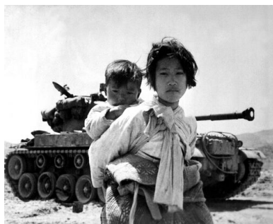
Koreańscy cywile, 1951 r. (domena publiczna)

Dopiero po tej dacie rozpoczęto przygotowania do tzw. zjednoczenia za pomocą siły czyli poprzez inwazję na południowego sąsiada i zaszczepienie tam rewolucyjnych idei. Podporządkowało temu zadaniu całe życie społeczno-gospodarcze Korei Północnej. Realizacją miała się zająć przede wszystkim armia. Wobec tego przyjęto kilka tez i wytycznych, wokół których organizować się miało całe życie. Należało przekształcić wojsko w armię całkowicie kadrową. Doprowadzić do „uzbrojenia całego narodu”. Hasło to rozumiano bardzo szeroko jako wytyczną, cel, zobowiązanie i życzenie wodza.