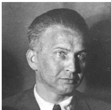
Ostatni komendant AK gen. Leopold Okulicki „Niedźwiadek”

decyzji pozostałych również zgodził się na swój udział.