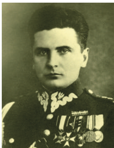
Stefan Paweł Rowecki ps. „Grot”

Inaczej natomiast sprawę struktur konspiracji w kraju widział rząd gen. Władysława Sikorskiego, który powstał w Paryżu. Rząd ten był tworzony przez przedwrześniową opozycję. Stąd też ogromna waga przywiązywana przez gen. Sikorskiego i jego współpracowników do marginalizowania przedstawicieli sanacji. Obawiali się sikorszczycy zbyt dużego wpływu wojskowych związanych ze środowiskiem piłsudczykowskiem na kształt konspiracji krajowej. I dlatego postanowili oddzielić konspirację wojskową od cywilnej.