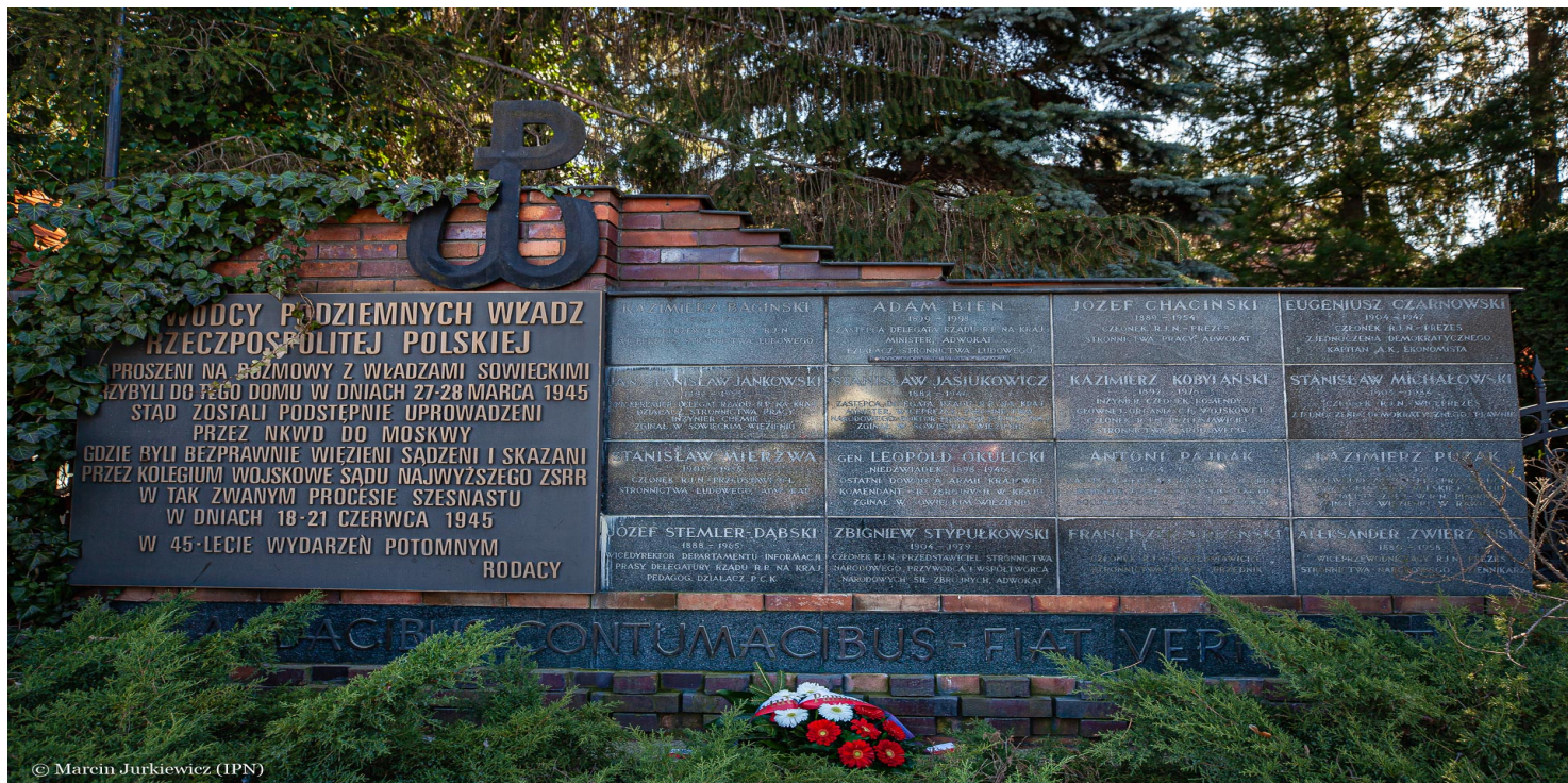
Pomnik w Pruszkowie ku czci szesnastu przywódców Polskiego Państwa Podziemnego, uprowadzonych w 1945 roku przez władze ZSRS, 2020.

https://przystanekhistoria.pl/pa2/tematy/polskie-panstwo-podziem/102943,Antoni-Pajdak-W-obronie-ludzkich-praw.html