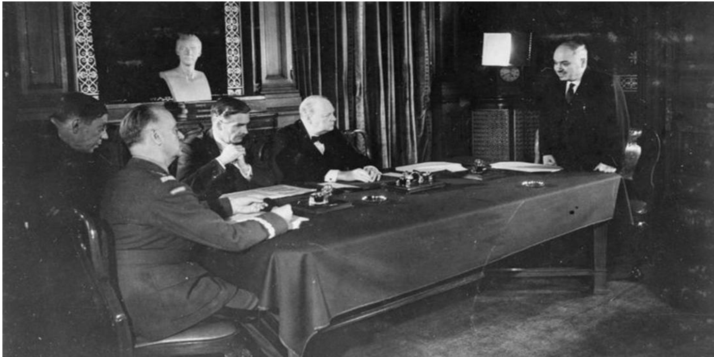
Podpisanie układu Sikorski-Majski

https://przystanekhistoria.pl/pa2/tematy/polska-na-uchodzstwie/96465,Uklad-Sikorski-Majski-Nie-byla-to-scena-z-Matejki.html