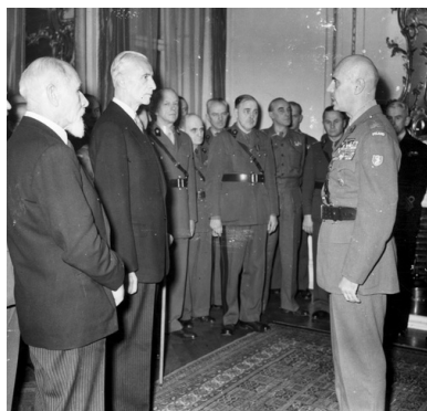
Spotkanie noworoczne u Prezydenta RP. Na pierwszym planie od lewej stoją: premier Tomasz Arciszewski, prezydent Władysław Raczkiewicz, gen. Władysław Anders - styczeń 1945 r.

W chwili gdy mocarstwa zachodnie wycofały swe uznanie dla rządu RP na uchodźstwie, jego premierem pozostawał socjalista Tomasz Arciszewski, natomiast urząd prezydenta nieprzerwanie od września 1939 r. pełnił Władysław Raczkiewicz. Polskie władze nie uznały dyktatu wielkich mocarstw, decydując się na utrzymanie struktur rządowych, których celem nadal pozostawała walka o odzyskanie przez Polskę niepodległości. Prezydent i premier oświadczyli, że wciąż stanowią jedyne legalne władze polskie. W 1946 r. utworzono dodatkowo Radę Polskich Stronnictw Politycznych, w której zgromadzono przedstawicieli większości sił politycznych działających na uchodźstwie.