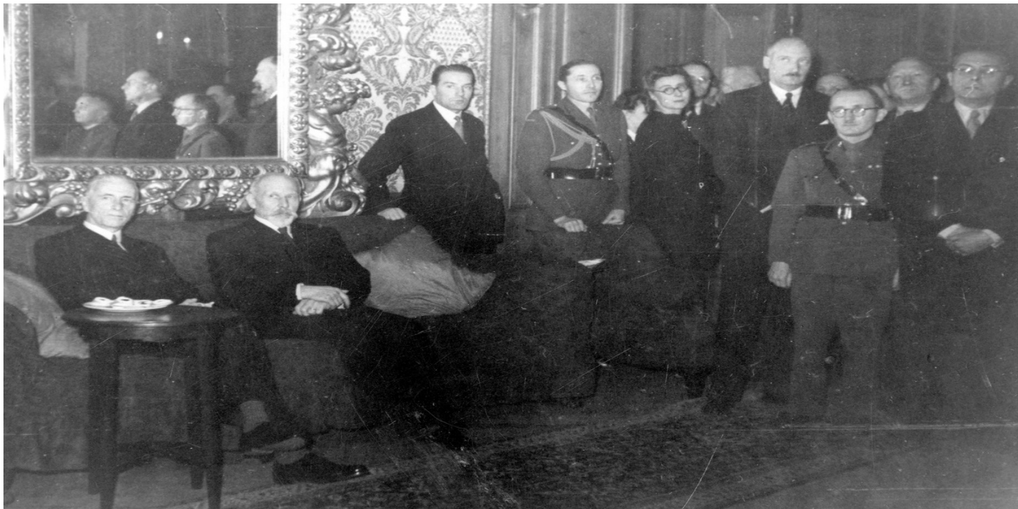
Spotkanie prezydenta RP Władysława Raczkiewicza z członkami rządu premiera Arciszewskiego i przedstawicielami uchodźstwa polskiego w Londynie.

https://przystanekhistoria.pl/pa2/tematy/polska-na-uchodzstwie/89371,Wobec-sowieckiego-zaboru-Polska-w-Londynie.html