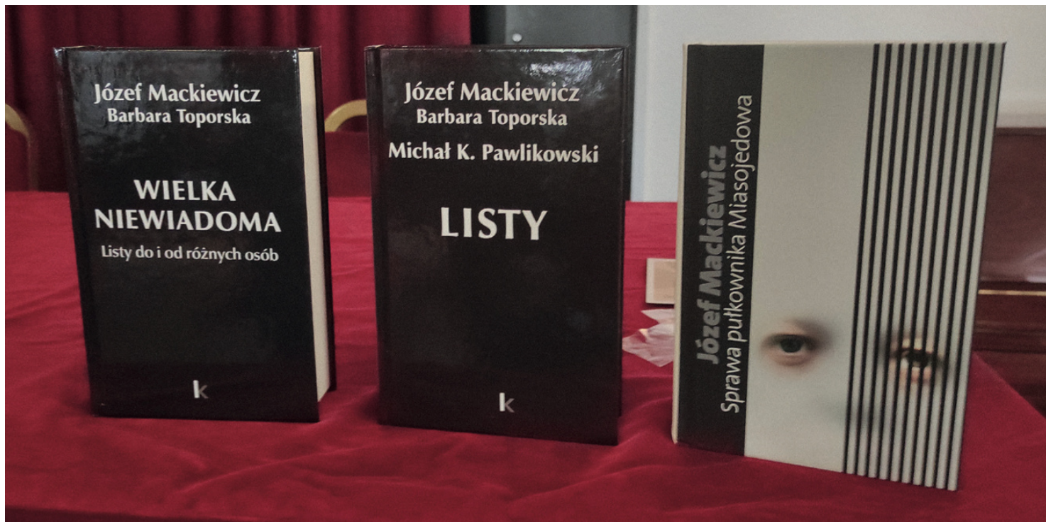
Stare i nowe publikacje dzieł Józefa Mackiewicza

https://przystanekhistoria.pl/pa2/tematy/polska-na-uchodźstwie/102058,Londyn-nie-zapomniał-o-Józefie-Mackiewicz.html