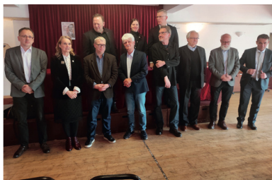
Uczestnicy konferencji

Tekst pochodzi z numeru 7-8/2022 „Biuletynu IPN”