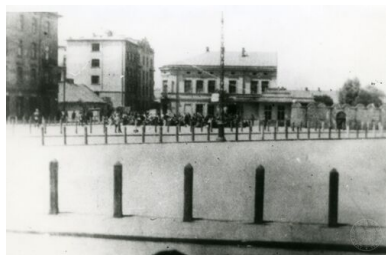
Likwidacja niemieckiego getta dla Żydów w okupowanym przez Niemców Krakowie. Pl. Zgody w kierunku ul. Lwowskiej.

Samo tzw. pozyskanie przebiegało dość nietypowo jak na procedury SB. Namacalnym efektem werbunku było najczęściej podpisanie zobowiązania do współpracy. Tajny współpracownik podpisywał je imieniem i nazwiskiem oraz wybranym przez siebie pseudonimem. W przypadku Pankiewicza w zachowanej dokumentacji nie ma jednak jakiegokolwiek zobowiązania do współpracy, a jedynie oświadczenie o zachowaniu tajemnicy rozmów.