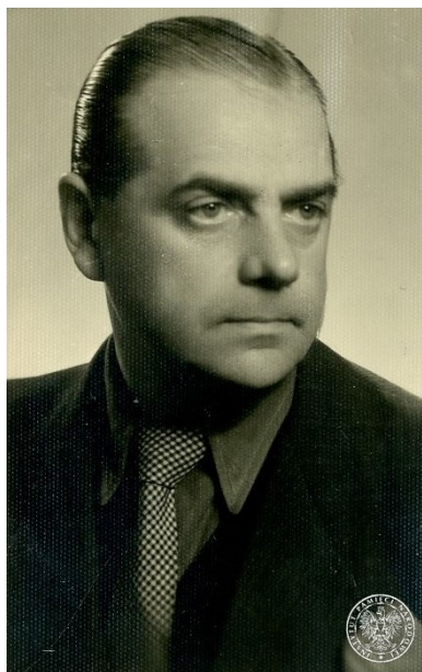
Tadeusz Pankiewicz, zdjęcie z dokumentu z roku 1961.

Po analizie teczek TW „Piotrowski”, znajdującej się w zasobach Oddziałowego Archiwum IPN w Krakowie, wyraźnie widać, że Tadeusz Pankiewicz wiedział z kim i o czym rozmawia, dlatego bardzo uważał, aby nikomu nie zaszkodzić. I swój cel osiągnął.