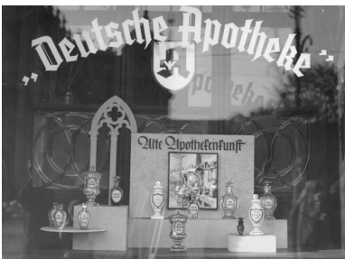
Okupowany przez Niemców Kraków, 1940. Witryna niemieckiej apteki przy pl. Dominikańskim.