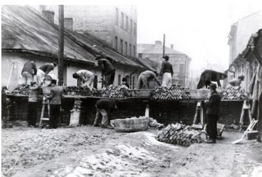
Budowa muru niemieckiego getta dla Żydów w Krakowie-Podgórzu.

W 1947 r. wydał, wielokrotnie wznawiane, wspomnienia z lat okupacji niemieckiej, zatytułowane Apteka w getcie krakowskim . To jedno z ważniejszych świadectw Zagłady, które powstały po wojnie. W 1983 r. Instytut Yad Vashem nadał mu tytuł Sprawiedliwego wśród Narodów Świata.