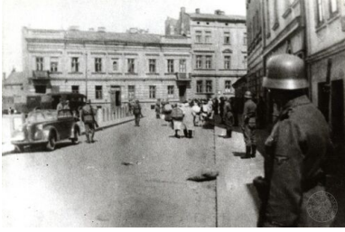
Likwidacja niemieckiego getta dla Żydów w okupowanym przez Niemców Krakowie. Plac Zgody.

Pod koniec grudnia 1961 r. na spisanej odręcznie notatce służbowej z odbytego spotkania z Pankiewiczem odnotowano: