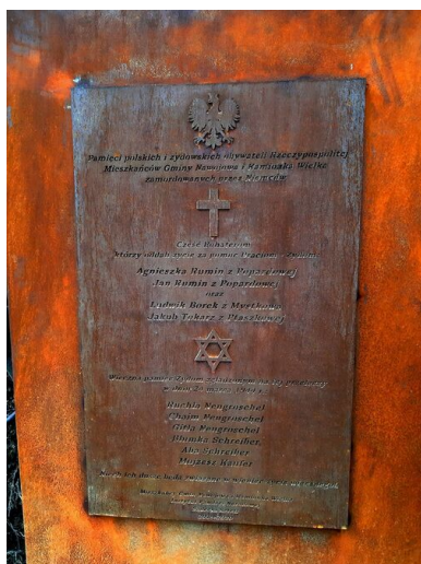
Tablica pamiątkowa na pomniku w Popardowej.