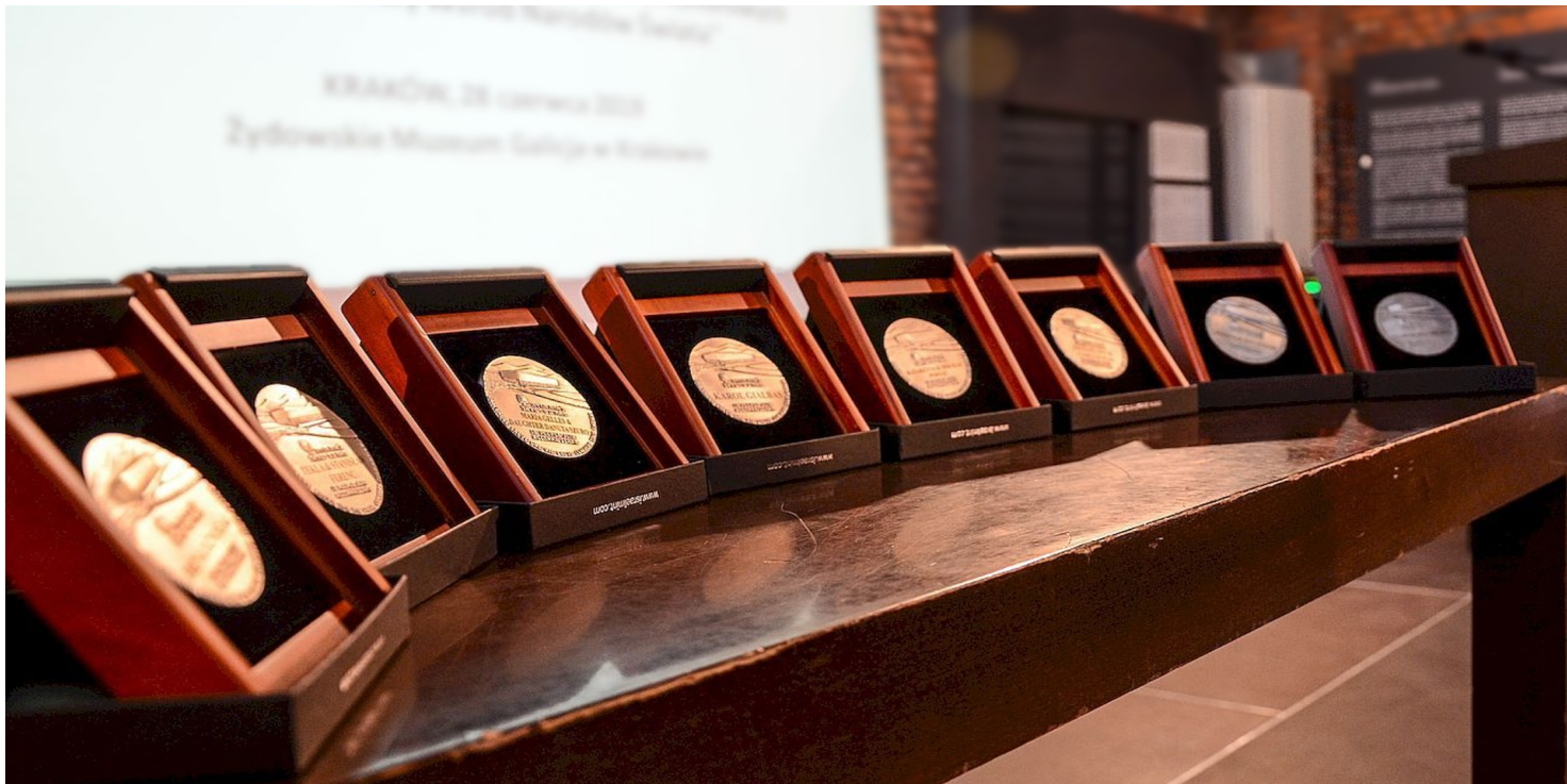
Madale Sprawiedliwy wśród Narodów Świata przyznawane przez Instytut Yad Vashem.

https://przystanekhistoria.pl/pa2/tematy/polacy-ratujacy-zydow/76529,Stella-czyli-gwiazda-O-Stelli-Zylbersztajn-Tzur.html