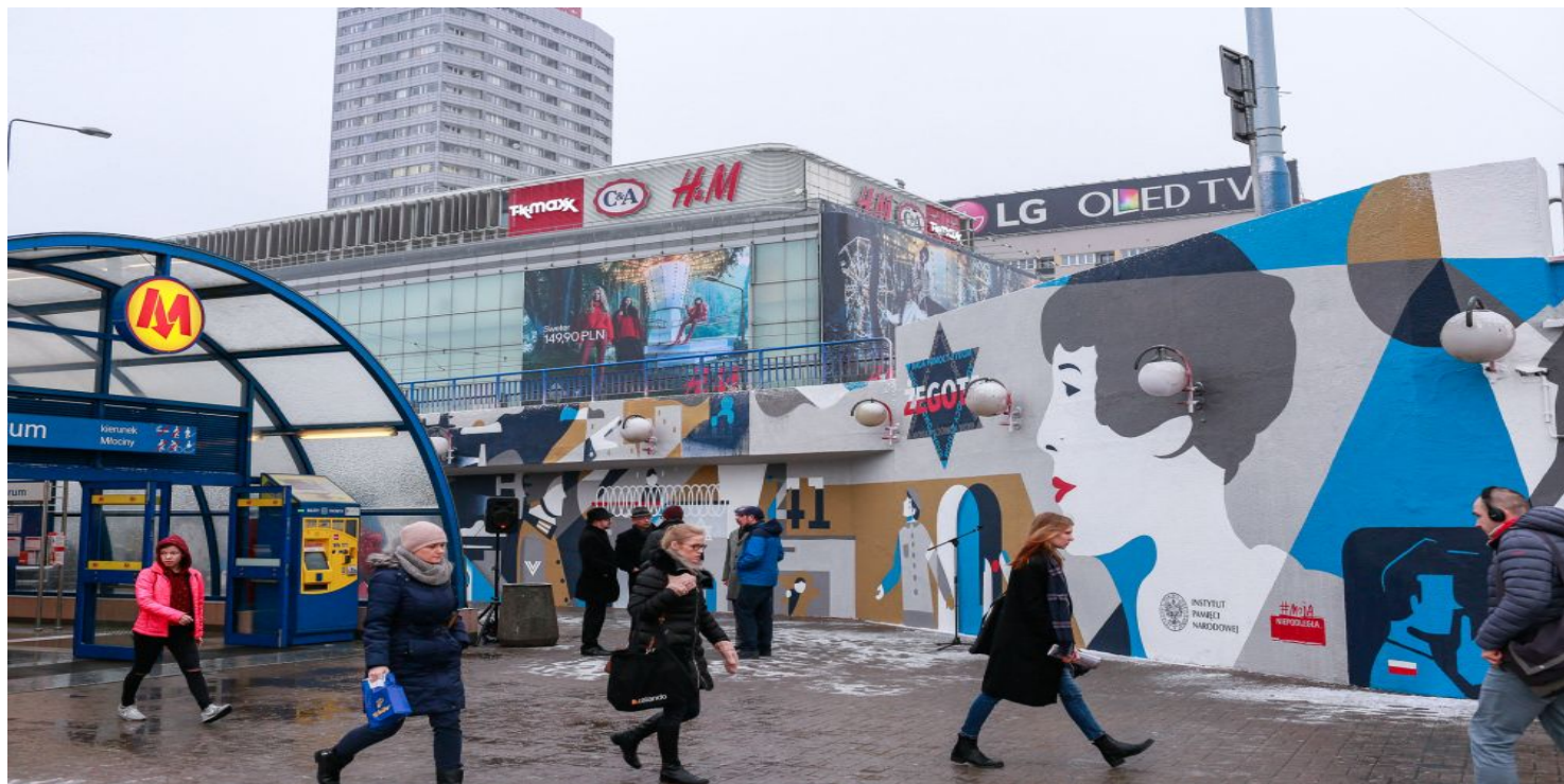
Mural poświęcony Radzie Pomocy Żydom „Żegota”.

https://przystanekhistoria.pl/pa2/tematy/polacy-ratujacy-zydow/71220,Bozy-szaleniec-w-czasach-Zaglady-Zofia-Kossak-Szczucka.html