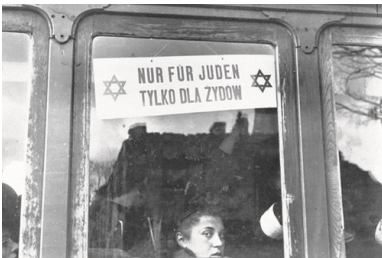
Tramwaj w getcie warszawskim, październik 1940 r. Fot.

Wydawało się pisarce, że milczącą obojętność zachowują wobec niesłychanej zbrodni także Polacy, zarówno przedwojenni „polityczni przyjaciele Żydów”, jak i ich przeciwnicy.