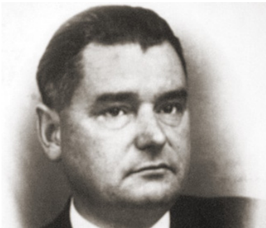
Henryk Sławik (1894-1944)