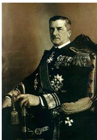
Miklós Horthy (1868 -1957) - węgierski polityk i wojskowy, regent Królestwa Węgier w latach 1920-1944