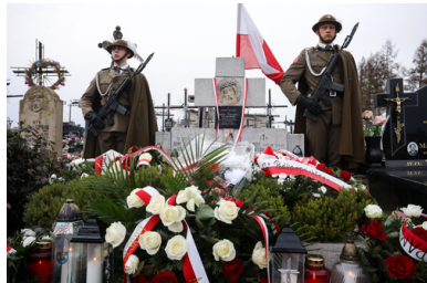
Grób rodziny Ulmów na cmentarzu w Markowej - 24 marca 2023.

chcieli, by Żydzi opuścili Polskę, i wspierali ich emigrację do Palestyny czy Ameryki. Charakterystyczny jest protest Zofii Kossak, która nie lubiła Żydów jako mniejszości polskiej, ale widziała w nich ludzi i walczyła o godność człowieka. To ona najgłośniej wołała: „Tak nie może być!”. Nawoływała społeczeństwo polskie i świat, aby coś zrobić w tej sprawie, oraz sama pomagała Żydom na dużą skalę w sposób zorganizowany.