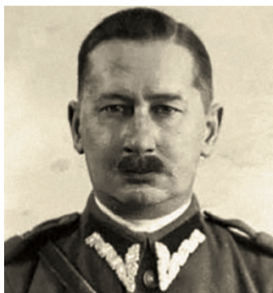
Kapitan Stanisław Bęklewski vel Staniszewski vel Pieszkowski „Bomba”, „Żuk”, „Stanisławski”, „Stanisław”, „Juno”

Rzepeckiemu nie udało się przeformowanie podziemnego wojska w organizację cywilną. W rzeczywistości istniały trzy zupełnie odrębne modele funkcjonowania Zrzeszenia WiN. Model statutowy udało się w zasadzie zrealizować tylko w Obszarze Południowym Zrzeszenia, tj. w Małopolsce, oraz w eksterytorialnych strukturach lwowskich i tarnopolskich odbudowywanych w południowo-zachodniej części tzw. Ziemi Odzyskanych. Jednak i tutaj, czyli w Krakowskim i na Rzeszowszczyźnie, nadal występowały grupy WiN prowadzące czynną samoobronę. W Obszarze Zachodnim (Wielkopolska i Pomorze) po pozbyciu się masowych szeregów poakowskich z tzw. dołów, organizacja nastawiona została na pracę ukierunkowaną na łączność ze sztabem Naczelnego Wodza na Zachodzie i na wywiad (obszar ten został rozbity przez MBP najszybciej, bo jeszcze jesienią 1945 r., a próby jego odbudowy nie powiodły się).