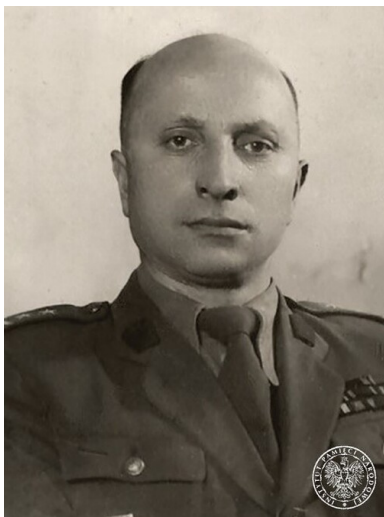
Bronisław Ochnio.