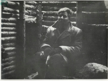
Jeden z członków HKP-KWP w bunkrze podczas wizji lokalnej