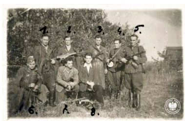
1 Patrol bojowy 11. Grupy Operacyjnej NSZ (NZW). Na