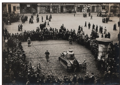
Francuski czołg Renault FT na rynku w Katowicach w dniu plebiscytu, 20 marca 1921 r.