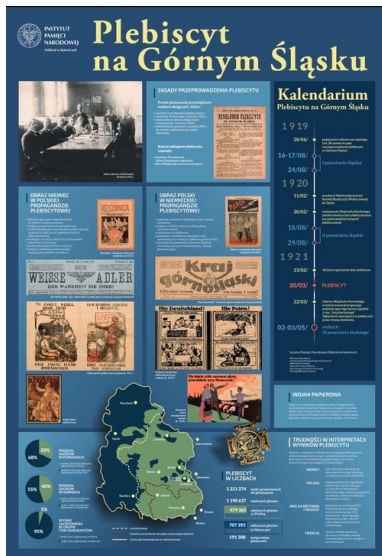
„Plebiscyt na Górnym Śląsku” - infografika przygotowana przez IPN Oddział w Katowicach