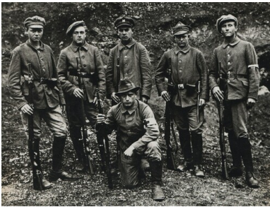
Grupa powstańców śląskich, 1921 r.