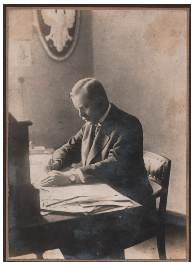
Wojciech Korfanty jako polski komisarz plebiscytowy.

Tymczasem na 3 maja 1921 r. zapowiedziano ogłoszenie przez Międzysojuszniczą Komisję decyzji odnośnie do losów Górnego Śląska, co przyspieszyło polską decyzję o przystąpieniu do powstania. Trudno przypuszczać, że odbyło się to bez aprobaty rządu RP, choć w momencie wybuchu powstania premier Wincenty Witos oficjalnie ogłosił neutralność Rzeczypospolitej i samowolność działań Korfantego. Niezależnie od rzeczywistych wątpliwości związanych z całym przedsięwzięciem, sytuację tę należy uznać za element polskiej gry dyplomatyczno-propagandowej. 30 kwietnia odbyło się zebranie polskich przywódców politycznych i wojskowych na Górnym Śląsku, podczas którego wydano ostateczne rozkazy – powstanie miało się rozpocząć w nocy z 2 na 3 maja 1921 r.