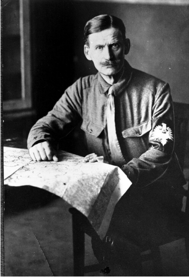
Płk Maciej Mielżyński „Nowina-Doliwa” - wódz naczelny III Powstania.