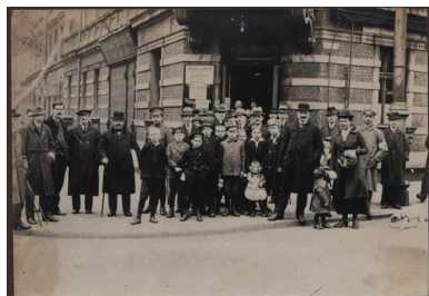
Grupa głosujących przed jednym z lokali wyborczych w Katowicach.

części obszaru plebiscytowego, zachodnie powiaty były w dużej mierze proniemieckie. Do tego traktat wersalski dopuszczał możliwość głosowania w plebiscycie górnośląskich emigrantów, z których wielu zamieszkiwało zachodnie, uprzemysłowione obszary Niemiec (zwłaszcza Zagłębie Ruhry). Strona niemiecka sprawnie wykorzystała tę okoliczność: uruchomiła stosowną propagandę oraz zorganizowała przerzut ok. 200 tys. ludzi na Górną Śląsk.