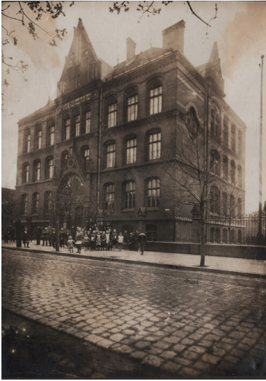
Siedziba powstańczej Naczelnej Władzy w Szopienicach (obecnie dzielnica Katowic) w okresie III Powstania Śląskiego (dziś VI LO im. Jana Długosza w Katowicach) - zdjęcie z 1921 r.