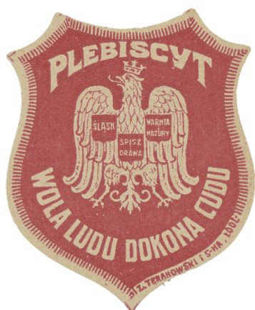
Odnaka kwestarska "Plebiscyt Wola ludu dokona cudu - Śląsk Spisz i Orawa Warmia i Mazury"

znalazły się północno-wschodnia Orawa i północno-zachodni Spisz. Ogólnie Polsce przypadły 1002 z 2220 km 2 i 142 z 435 tys. ludności Śląska Cieszyńskiego. Czechosłowacja otrzymała okręg przemysłowy i 100 tys. ludności polskiej. Na Spiszu i Orawie 27 wsi z 30 tys. ludności mocarstwa przyznały Polsce, zaś pod władzą Pragi znalazły się 44 wsie zamieszkiwane przez 40 tys. ludzi. Ententa przy podziale terytorium brała pod uwagę w większym stopniu niż skład narodowy ludności linię wpływów kapitału francuskiego i granicę majątków hrabiów Larisch.