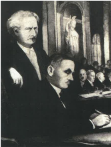
Moment złożenia podpisu przez Romana Dmowskiego pod traktatem wersalskim ("Przewodnik Katolicki" 1929, nr 28)

Zabiegając o korzystne dla Polski rozstrzygnięcia, Roman Dmowski wystosował dwie noty do przewodniczącego Komisji do spraw Polskich Julesa Cambona. Pierwsza z nich datowana na 28 lutego dotyczyła granicy zachodniej, druga, z 3 marca 1919 r. – granicy wschodniej. 12 marca 1919 r. komisja ogłosiła sprawozdanie, w którym uwzględniono niemal wszystkie postulaty strony polskiej odnośnie do przebiegu granicy zachodniej. Zapowiadano jedynie przeprowadzenie plebiscytu na terenie Mazur. 15 marca ustalenia zatwierdził Centralny Komitet Terytorialny. Raport ten spotkał się jednak z bardzo krytyczną oceną brytyjskiego premiera Davida Lloyd George'a, który stwierdził, iż nie uwzględniono w nim oczekiwań i argumentów strony niemieckiej. Przeciwwstawiał się wówczas, jak się okazało skutecznie, przekazaniu Polsce Gdańska, co było jednym z głównych postulatów strony polskiej. Nie ulega wątpliwości, że szef brytyjskiej dyplomacji chciał zapobiec nadmiernemu osłabieniu Niemiec, które z punktu widzenia Wielkiej Brytanii stanowiły istotny czynnik zapewniający równowagę sił na kontynencie europejskim.