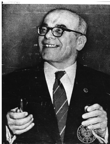
Władysław Gomułka, październik 1956. Fotokopia najprawdopodobniej dziesiątej

„to przekreślanie niepodległości naszego kraju, to skreślanie Polski z mapy państw europejskich”.