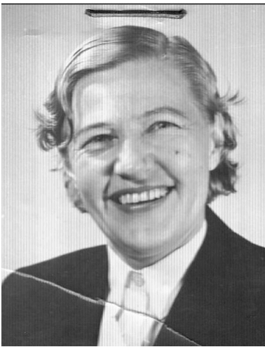
Zofia Wasilkowska - minister sprawiedliwości PRL 1956-1961