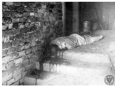
Zwłoki Józefa Hachlicy, prezesa Koła PSL w Krakowie-Prokocimiu, zamordowanego 22 października 1946 r. przed drzwiami własnego domu Fot. AIPN

Odezwa wyborcza Naczelnego Komitetu Wykonawczego PSL, 8 grudnia 1946 r. Fot. AIPN