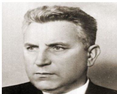
Edward Ochab (1906 - 1989)