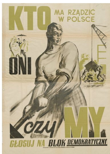
Plakat wyborczy tzw. Bloku Demokratycznego

Pułkownik miał się jeszcze sowieckiemu dyktatorowi przydać. Stalin planował bowiem przeprowadzenie nad Wisłą wyborów parlamentarnych (do czego zobowiązał się w Jałcie), które miały dowieść – w przekonaniu komunistów – słabości politycznej opozycji. W rzeczywistości chodziło o rozbitcie PSL Stanisława Mikołajczyka, a cel ten starano się osiągnąć wszystkimi możliwymi środkami.