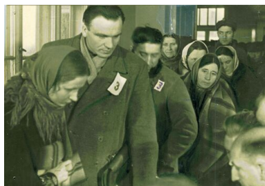
Kolejka w lokalu wyborczym, 19 I 1947 r.