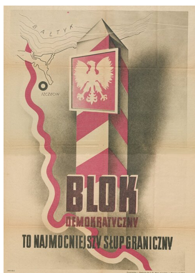
Plakat wyborczy tzw. Bloku Demokratycznego