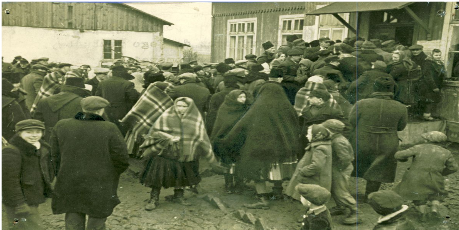
Mieszkańcy wsi przed lokalem wyborczym, 19 I 1947 r. Fot. AIPN

https://przystanekhistoria.pl/pa2/tematy/partia-omunistyczna/51676,Demokracja-na-sowiecka-modle-wybory-do-Sejmu-z-19-stycznia-1947-roku.html