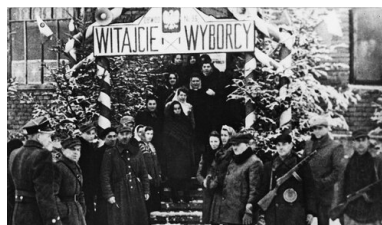
Wejście do lokalu wyborczego w Sanoku, 19 I 1947 r.

Według oficjalnych danych PPR i jej satelici uzyskali 80,1 proc. głosów przy zaledwie 10,3 proc. PSL-u. „Wybory to taka szkatułka: wchodzi Mikołajczyk – wychodzi Gomułka” – powtarzali ci, którzy nie mieli wątpliwości, co działo się 19 stycznia.