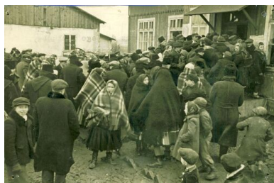
Mieszkańcy wsi przed lokalem wyborczym, 19 I 1947 r.