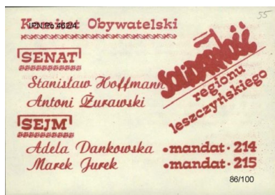
Ulotka wyborcza kandydatów KO „Solidarność” z terenu województwa leszczyńskiego