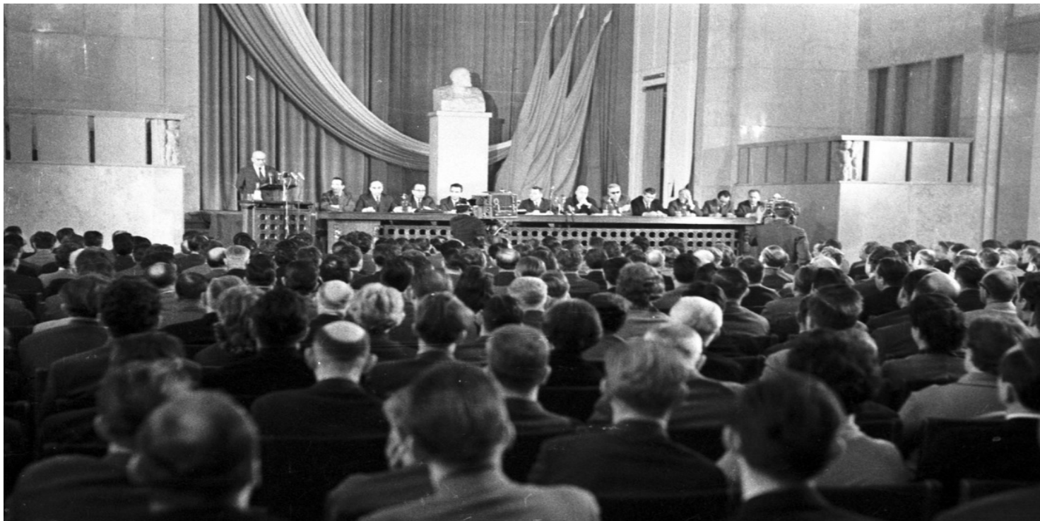
Spotkanie aktywu w Urzędzie Rady Ministrów. Z mównicy przemawia Władysław Gomułka.

https://przystanekhistoria.pl/pa2/tematy/partia-omunistyczna/101896,Stabilizacja-w-PZPR.html