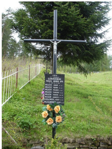
Zbiorowy grób rodziny Wójcików i ich sąsiadów ofiar napadu nacjonalistów ukraińskich z 20 IV 1945 r. Stan z 2012 r.

„Ostrowercha”, ranny został dowódca, który musiał się wycofać z pola walki. Na ten odcinek „Chrin” skierował swoje rezerwy. Po ciężkiej walce zdobyto leśniczówkę.