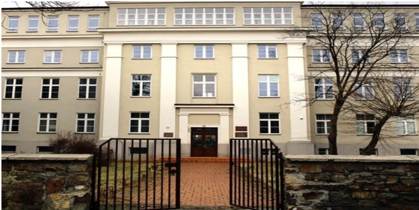
Budynek szkoły przy ul. Leśnej. Widok współczesny

https://przystanekhistoria.pl/pa2/tematy/oswiata/125314,Panstwowe-Seminarium-Nauczycielskie-w-Kielcach-w-latach-1917-1932.html