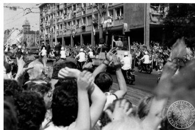
Jan Paweł II przejeżdża ulicami Szczecina pozdrawiany przez wiernych, 11 czerwca 1987 r.