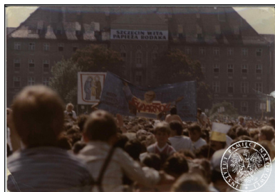
Wierni zgromadzeni na mszy papieskiej na Jasnych Błoniach w Szczecinie, 11 czerwca 1987 r.

Krytycznie oceniano dystrybucję pisma „Grot”, a także rozprawianie znaczków pocztowych z serii „Polskiego Państwa Podziemnego”, co nastąpiło tuż przed wyjazdem na pielgrzymkę do Piekar Śląskich. W związku z tym zarzutami oczekiwano, że kuria podejmie stosowne działania i wpłynie na księży z parafii pw. św. Stanisława Kostki współpracujących z opozycją.