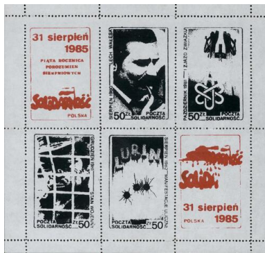
Seria znaczków upamiętniająca piątą rocznicę porozumień sierpniowych, wydana w 1985 r.