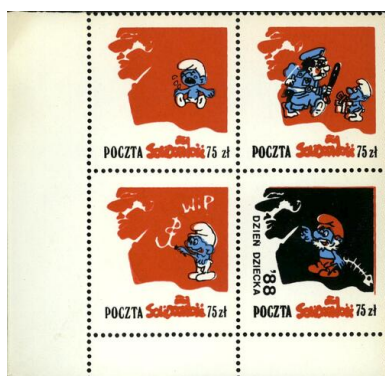
Seria znaczków wydana na okoliczność dnia dziecka 1988 r.

Znaczki wydawane w podziemiu przez „Solidarność” można podzielić na trzy zasadnicze grupy. To satyryczne rysunki przedstawiające np. milicjantów lub partyjnych notabli, znaczki o tematyce patriotyczno-historycznej (wydane np. z okazji rocznic historycznych) i znaczki ilustrujące bieżące wydarzenia np. strajki.