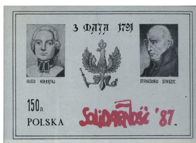
Znaczek upamiętniający Konstytucję 3 Maja, wydany w 1987 r. (ze zbiorów AIPN)