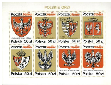
Seria znaczków Polskie Orły