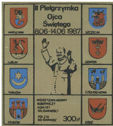
Znaczek upamiętniający III pielgrzymkę Jana Pawła II do Polski, wydany w 1987 r.