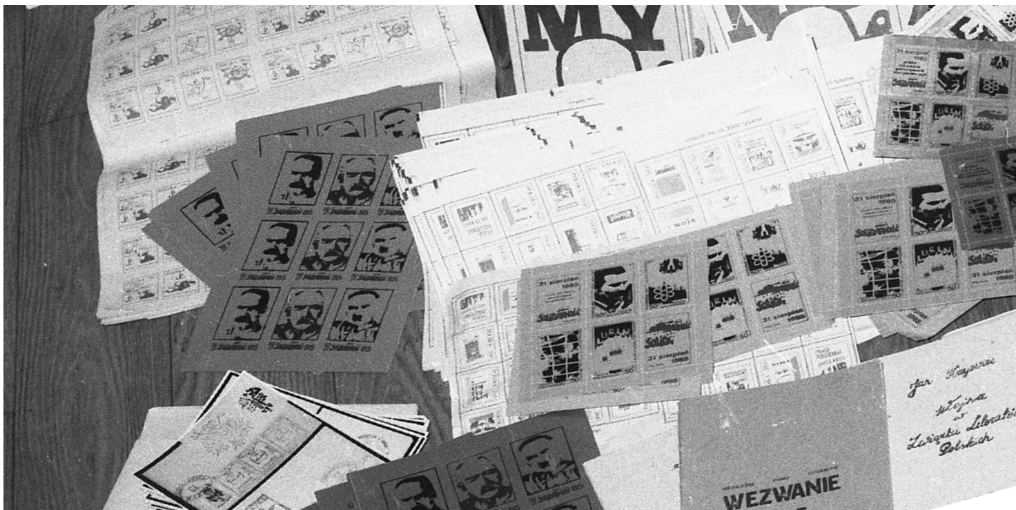
Nielegalne znaczki pocztowe z lat 80. XX w. (ze zbiorów AIPN)

https://przystanekhistoria.pl/pa2/tematy/opozycja-w-prl/94259,Znaczki-pocztowe-Solidarnosci.html