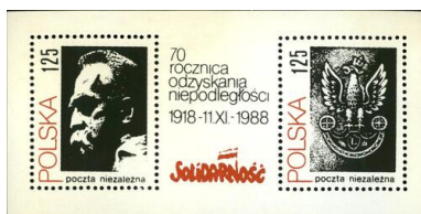
Znaczek upamiętniający 70. rocznicę odzyskania przez Polskę niepodległości, wydany w 1988 r.