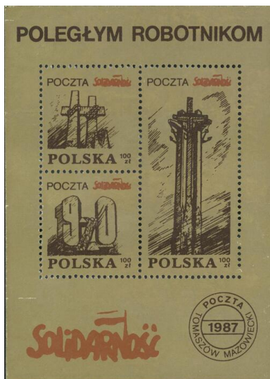
Znaczek upamiętniający krwawe stłumienie strajków robotniczych w grudniu 1970 r., wydany w 1987 r.