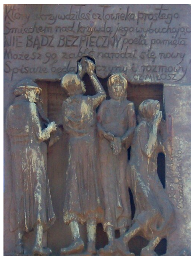
Tablica ze zdjęciem Czesława Miłosza na gdańskim Pomniku Poległych Stoczniovców 1970

francuskie o azyl polityczny. Od tego czasu tworzył na emigracji, m.in. demaskując oblicze polskiego komunizmu. Oczywiście interesował się sprawami polskimi, choć podczas wizyty w kraju w czerwcu 1981 r., podczas tzw. solidarnościowego karnawału, wyraźnie dystansował się od zdarzeń w ojczyźnie. Nie chciał się nawet na ich temat wypowiadać, jednak – jak się okazuje – do czasu.