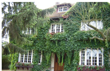
Siedziba Instytutu Literackiego w Maisons-Laffitte, 2006

Opinie wypowiedane przez czołowych przedstawicieli emigracji interesowały oczywiście peerelowskich przywódców. Pracowicie, więc zbierali je dla nich funkcjonariusze Służby Bezpieczeństwa. Tak było również w przypadku Czesława Miłosza, laureata literackiej Nagrody Nobla w 1980 r., a dla komunistów – zdrajcy.