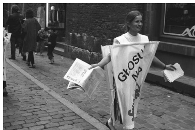
Wybory kontraktowe z 1989 r. w Krakowie.

podwyższonej gotowości, a informacja ta wzbudziła wśród liderów opozycji niepewność co do dalszych działań władz.