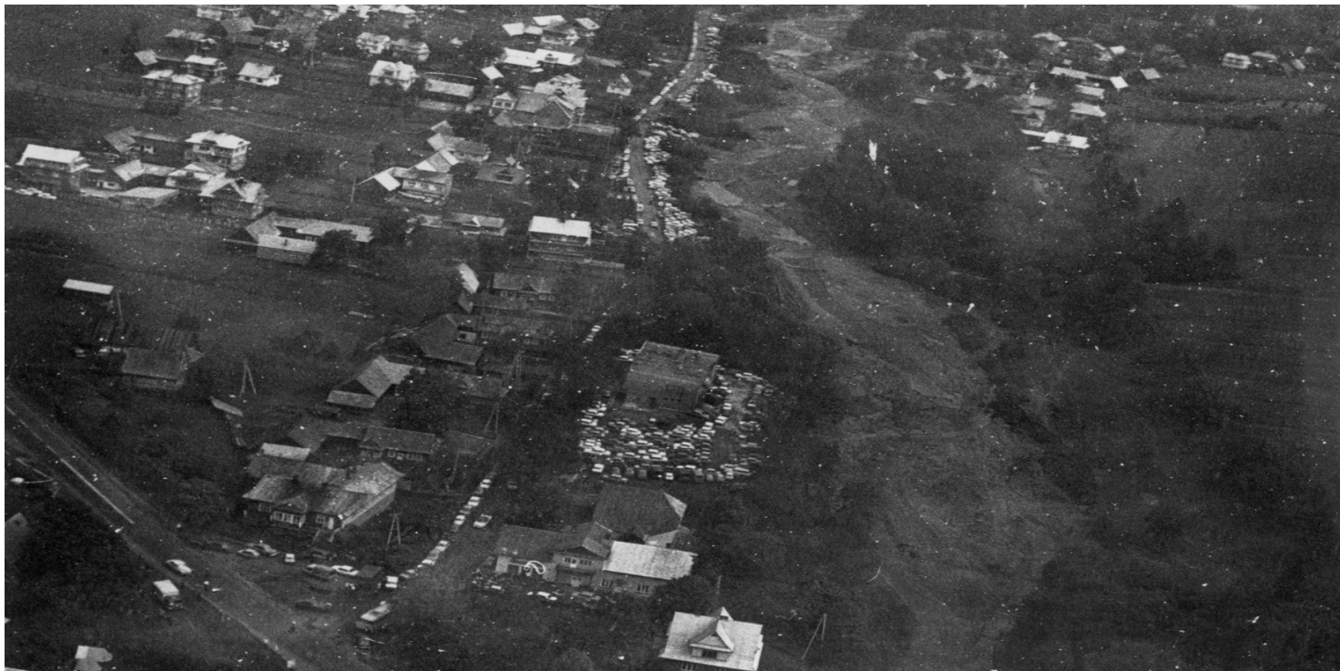
Obserwacja operacyjna lotniska i Nowego Targu, w dniu spotkania z papieżem Janem Pawłem II w 1979 r.

https://przystanekhistoria.pl/pa2/tematy/opozycja-w-prl/80860,Solidarnosc-Rolnikow-Indywidualnych-na-Podhalu-Spizu-i-Orawie-w-latach-1980-1981.html