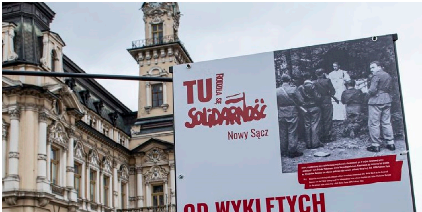
Wystawa „TU rodziła się Solidarność” w Nowym Sączu

https://przystanekhistoria.pl/pa2/tematy/opozycja-w-prl/80098,Poczatki-niezaleznego-ruchu-zwiazkowego-w-Gorlicach.html