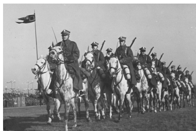
Defilada 6 Pułku Ułanów Kaniowskich podczas Święta Niepodległości na Polu Mokotowskim w Warszawie, 11 listopada 1934 r.