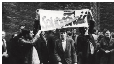
Demonstracja Solidarności przed katedrą św. Jana w Warszawie, 1 maja 1984 r.